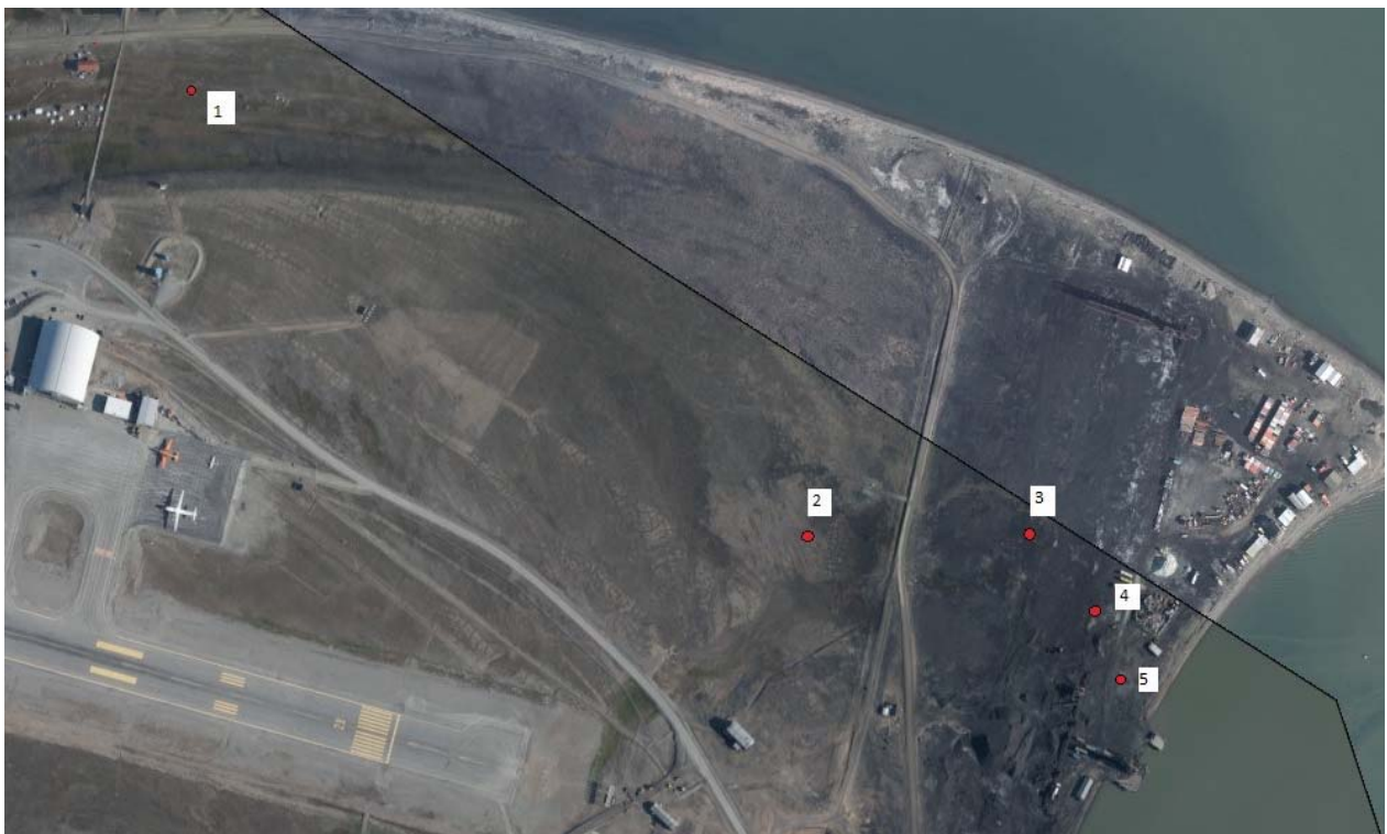
Figur 1 – Målepunkter 1-5 for støvnedfallsmålinger på Hotellneset i perioden mai – desember 2016

Målepunktene ble valgt i samråd med NTNU for antatt mest utsatte plasseringer mht fremherskende vindretning. Målepunktene framgår av flybilde på figur 1, samt med koordinater i tabell 1.