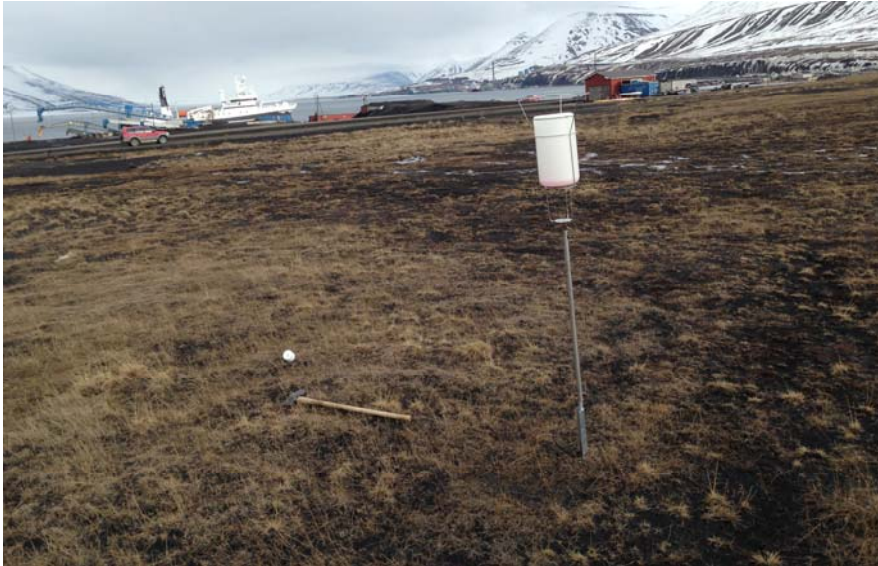
Figur 2 – Stativ med støvsamler (målepunkt 2) vest for kullkai/-tipp.

I støvsamlerne fylles det 3-5 desiliter veske slik at støv som faller ned blir akkumulert i væsken. I vår prøvetaking er det brukt rødsprit blandet med vann. Væskenivået må etterses og etterfylles ved behov i løpet av prøveperioden på 30 døgn \pm 2 døgn.